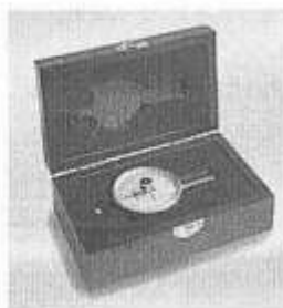
Fornito all'interno di Una robusta custodia In legno

Garanzia Lo strumento è garantito per un anno a partire dalla data di acquisto per quanto riguarda difetti meccanici di produzione. La garanzia non è applicabile in caso di guasto causato dall'operatore o in caso di manomissione dello strumento.